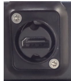
HDMI-Anschluss (nur PAM-Serie)