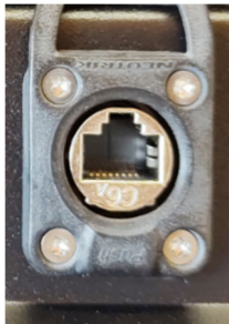
LAN-Anschluss (nur PAP-Serie)