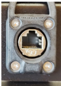
LAN-Anschluss (nur PAP-Serie)